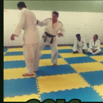
AVANÇA NA ESCOLA E NA BOLA