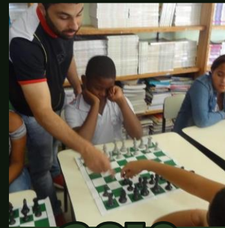
XADREZ MENTES BRILHANTES