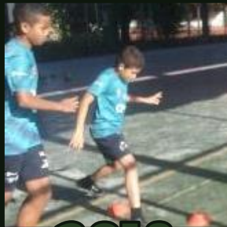
AVANÇA NA ESCOLA E NA BOLA