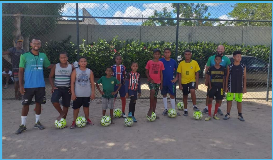
Feira de Santana/MG